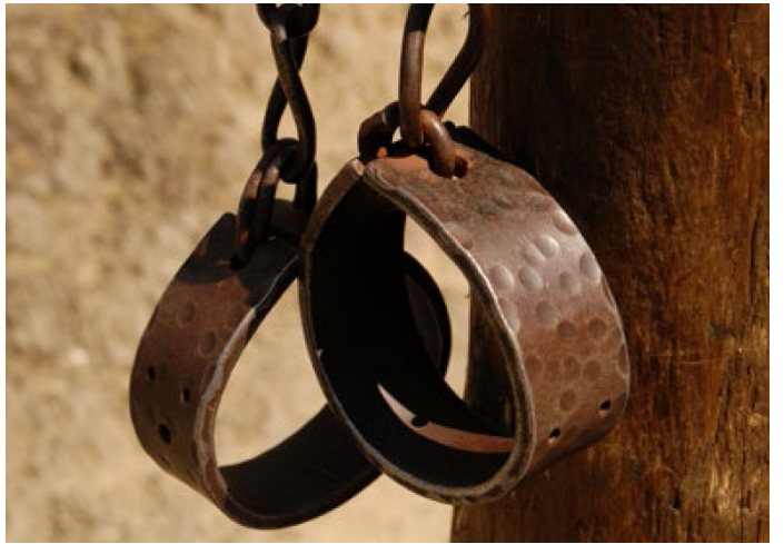
യജമാനനെ വിട്ട് ഓടിപ്പോയ അടിമയായിരുന്നു ഒന്നേസിമോസ്

കുറ്റകൃത്യങ്ങൾ ചെയ്തതുകൊണ്ടല്ല; കർത്താവായ യേശുവിനോടുള്ള വിശ്വസ്തതയും ദൈവം അവനെ ഏൽപ്പിച്ച ദൗത്യവും നിമിത്തമായിരുന്നു താൻ തടവിലാക്കപ്പെട്ടത്. ദൈവപരിപാലനയിൽ, പൗലോസും ഒന്നേസിമോസും തടവിൽ വെച്ച് കണ്ടുമുട്ടി., ഈ ഓടിപ്പോയ അടിമയോട് സുവിശേഷത്തെക്കുറിച്ചും തന്റെ പാപങ്ങളെക്കുറിച്ച് അനുതപിക്കേണ്ടതിന്റെയും രക്ഷകനിൽ ആശ്രയിക്കേണ്ടതിന്റെ ആവശ്യകതയെക്കുറിച്ചും സംസാരിക്കാനുള്ള അവസരങ്ങളൊന്നും പൗലോസ് നഷ്ടപ്പെടുത്തിയില്ലെന്ന് നമുക്ക് ഉറപ്പാണ്. അതാണ് സംഭവിച്ചത്!