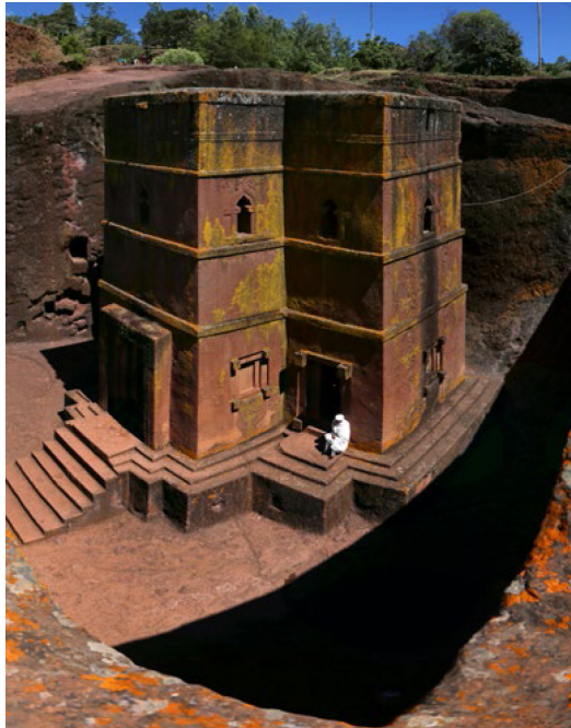
ഐത്യോപ്യയിലുള്ള ഒരു സ്ഥലത്തെ പാറയിൽ തീർത്ത പള്ളി

ദൈവകൃപയാൽ രക്ഷിക്കപ്പെടുക എന്നത് തീർച്ചയായും ഒരു അത്ഭുതമാണ്, അതായത് രക്ഷ നമ്മുടെ സ്വന്തം പ്രയത്നത്താൽ നമുക്ക് ലഭിക്കുന്നില്ല. കർത്താവായ യേശുവിൽ ദൈവം നമുക്കുവേണ്ടി ചെയ്തതിന്റെ ഫലമായി മാത്രമേ അത് ഉണ്ടാകൂ. അവൻ "സന്തോഷിച്ചും കൊണ്ട് തന്റെ വഴിക്ക് പോയി" (വാക്യം 39) എന്ന് നമ്മോട് പറയുന്ന സന്തോഷകരമായ കുറിപ്പിലാണ് കഥ അവസാനിക്കുന്നത്. അവൻ രക്ഷകനെ കണ്ടെത്തി, അവനെ സ്വീകരിക്കുന്നതിൽ, അവന്റെ പുഴയത്തിന്റെ അഗാധമായ ആഗ്രഹങ്ങൾ സാധിച്ചതിൽ സന്തോഷവാനായി. നമ്മളോരോരുത്തരും ഒരു ചോദ്യം ചോദിക്കേണ്ടതുണ്ട്: 'എന്റെ വ്യക്തിപരവും ശാരീരികവുമായ രക്ഷയ്ക്കായി ഞാൻ ഈ രക്ഷകനിൽ മാത്രമാണോ ആശ്രയിക്കുന്നത്?'