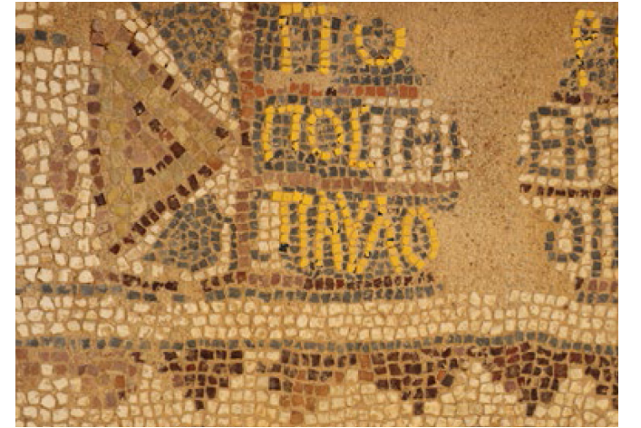
ഫിലിപ്പിയിലെ ഒരു സ്ഥലത്തു പുരാവസ്തു കണ്ടെത്തിയ മൊസൈക്ക് തറയിൽ പൗലോസ് എന്ന എഴുതിയിരിക്കുന്നു

"കർത്താവായ യേശുക്രിസ്തുവിൽ വിശ്വസിക്കുക, എന്നാൽ നീ രക്ഷ പ്രാപിക്കും" എന്ന പൗലോസും ശീലാസും നൽകിയ മറുപടി നമുക്ക് യഥാർത്ഥ രക്ഷയുടെ വഴി നൽകുന്നു.