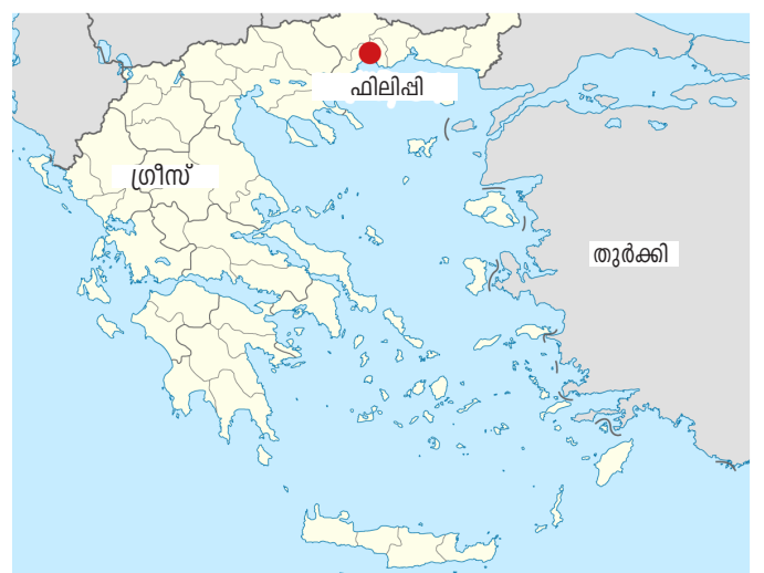
ദൂപടത്തിൽ ഫിലിപ്പിയുടെ സ്ഥാനം

പിടിക്കപ്പെടുകയും അടിയേൽക്കപ്പെടുകയും തടവിലാക്കപ്പെടുകയും ചെയ്തതിന്റെ അനുഭവം പൗലോസിനും ശീലാസിനും വളരെ വേദനാജനകമാണെന്ന് നമുക്ക് ഉറപ്പാണ്, എന്നിട്ടും അവർ നിരാശരാകാൻ അനുവദിച്ചില്ല. ദൈവത്തിലുള്ള അവരുടെ വിശ്വാസം അചഞ്ചലമായി നിലകൊള്ളുന്നു എന്ന് അവരുടെ പ്രാർത്ഥനയും പാട്ടും സൂചിപ്പിക്കുന്നു. (വാക്യം 25) ഇത് അവരെ മുമ്പോട്ട് സംഭവിക്കേണ്ട കാര്യങ്ങൾക്കായി അവരെ ഒരുക്കി ആദ്യം ദുകമ്പവും പിന്നെ വല്ലാതെ ദ്രമിച്ചുപോയ ഒരു കാരാഗൃഹപ്രമാണിയുടെ ഒരു അന്വേഷണവും: "രക്ഷ പ്രാപിപ്പാൻ ഞാൻ എന്തു ചെയ്യണം?"