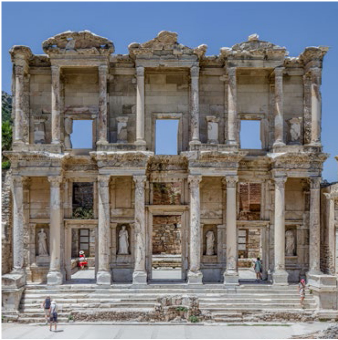
പൗലോസിന്റെ കാലത്തെ എഫെസോസിലെ ഒരു ലൈബ്രറി കെട്ടിടം

കർത്താവായ യേശുവിൽ വിശ്വാസം അർപ്പിച്ചുകൊണ്ട് ആളുകൾ സുവിശേഷത്തോട് പ്രതികരിക്കുമ്പോൾ സംഭവിക്കുന്ന ചില വലിയ മാറ്റങ്ങളെ ആണ് ഈ പ്രസ്താവനകൾ എടുത്തുകാണിക്കുന്നത് .