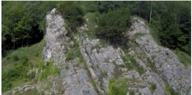
യുഗങ്ങളുടെ പാറ

“പിളർന്നൊരു പാറയെ നിന്നിൽ ഞാൻ മറയട്ടെ തുറന്ന നിൻ ചങ്കിലെ രക്തനിർ എൻ പാപത്തെ നീക്കി സുഖം നൽകട്ടെ മറ്റും രക്ഷിക്കെയെന്നെ”