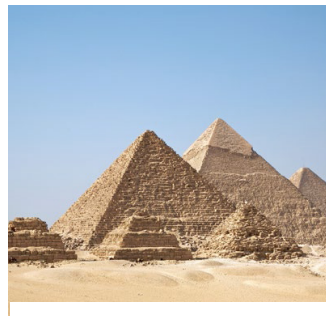
പിരമിഡ് (ഈജിപ്റ്റ്) അവലംബം- വികിപീഡിയ

യിസ്രായേൽജനത്തിന്റെ ദീർഘകാലചരിത്രം പരിശോധിച്ചാൽ, ഇതായിരുന്നു അവർക്കു ലഭിച്ച ഏറ്റവും വലിയ "രക്ഷ". മറ്റു സന്ദർഭങ്ങളിൽ ദൈവം അവരെ പലവിധ കഷ്ടതകളിൽ നിന്നു രക്ഷിച്ചിട്ടുണ്ട്. എന്നാൽ "മിസ്രയീമിൽ നിന്നുള്ള പുറപ്പാട്" മറ്റൊറ്റിനേക്കാളും വലിയ ഒരു രക്ഷയായിരുന്നു. ലോകത്തെല്ലായിടത്തുമുള്ള എല്ലാ യെഹൂദന്മാരും, ഈ നാളുകൾ വരെയും ഈ മഹാരക്ഷയെ ഒരു ഉത്താപകമായി എല്ലാ വർഷവും ഓർത്ത് ആചരിക്കാറുണ്ട്. എന്നാൽ, നമ്മെ സംബന്ധിച്ചിടത്തോളം ഇതിന് ഏറ്റവും പ്രത്യേകതയുള്ള ഒരു അർത്ഥവും പ്രാധാന്യവുമുണ്ട്, കാരണം ഇത് നമുക്കുവേണ്ടി ദൈവം ഒരുക്കിയ ഇക്കാലത്തെ രക്ഷാമാർഗ്ഗത്തെ വളരെ വ്യക്തമായി വരച്ചുകാട്ടുന്നുണ്ട്. പുറപ്പാടുപുസ്തകത്തിൽ കാണുന്ന "രക്ഷ"യിൽ അടങ്ങിയിരിക്കുന്ന സത്യങ്ങൾ എപ്രകാരമാണ് ദൈവം ഇന്ന് പാപികളുടെ രക്ഷയ്ക്കായി ഒരുക്കിയിരിക്കുന്ന മാർഗ്ഗത്തെക്കുറിച്ചുള്ള പുതിയനിയമത്തിലെ ഉപദേശവുമായി ചേർന്നിരിക്കുന്നതെന്ന കാര്യം നന്നായി ശ്രദ്ധിക്കുക.