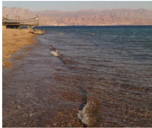
ചെങ്കടൽ : അവലംബം: വിക്സിപീഡിയ

അവർ അകപ്പെട്ടുപോയ വിഷമാവസ്ഥയിൽനിന്ന് സ്വയം രക്ഷപ്പെടുന്നതിന് അവർക്കു ചെയ്യുവാൻ കഴിയുന്ന ഒരു കാര്യവുമുണ്ടായിരുന്നില്ല.