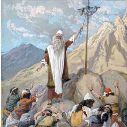
പിള്ള സർപ്പത്തെ ഉയർത്തിയിരിക്കുന്നു

മരുഭൂമിയിലായിരുന്ന യിസ്രായേൽജനത്തെ സംബന്ധിച്ച്, അത് പാപത്തിന്റെ ഫലമായ മരണം അനുഭവിക്കുന്ന, അല്ലെങ്കിൽ ദൈവത്തിന്റെ വഴി തിരഞ്ഞെടുത്തതിനാൽ ജീവൻ കണ്ടെത്തുന്ന ഒരു സംഭവമായിരുന്നു. നമ്മെ സംബന്ധിച്ചിടത്തോളം, നമ്മുടെ തിരഞ്ഞെടുപ്പ് അതിനേക്കാൾ നിർണ്ണായകമാണ്; അത് ഒന്നുകിൽ, ദൈവത്തിൽനിന്ന് എന്നേയ്ക്കുമായി അകന്നു പോകുകയും നമ്മുടെ പാപത്തിനുള്ള ശിക്ഷ ഏറ്റുവാങ്ങുകയും ചെയ്യുവാൻ ഇടയാക്കുന്നു, അല്ലെങ്കിൽ ദൈവത്തെയും അവിടുന്ന്