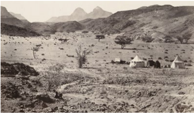
1862ൽ സീനായ് മരുഭൂമി

യിസ്രായേൽജനം മിസ്രയീമിൽനിന്നും കനാനിലേയ്ക്കു യാത്ര ചെയ്തതിനിടയിൽ സംഭവിച്ച ഈ സംഭവം, ദൈവം നമുക്കായി ഒരുക്കിയിരിക്കുന്ന രക്ഷയുടെ മറ്റു ചില സവിശേഷതകൾ മനസ്സിലാക്കുവാൻ നമ്മെ സഹായിക്കുന്നു.