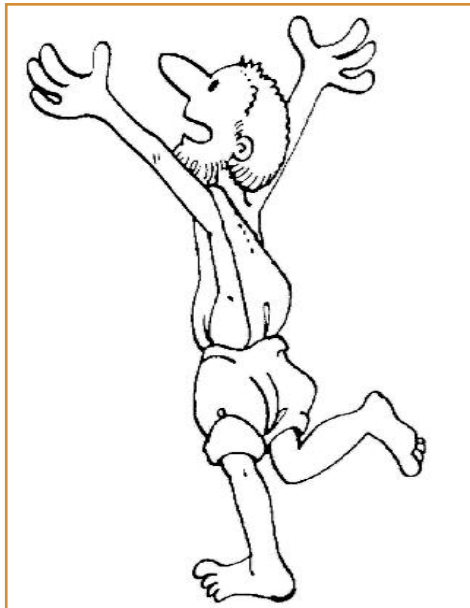
Male den dankbaren Mann aus.

Eines Tages ging Jesus in ein Dorf und traf zehn Männer, die Lepra hatten. Dies war eine furchtbare Hautkrankheit. Wenn man sie hatte, durfte man nicht mehr zu Hause leben. Kaum jemand wurde jemals von Lepra geheilt.