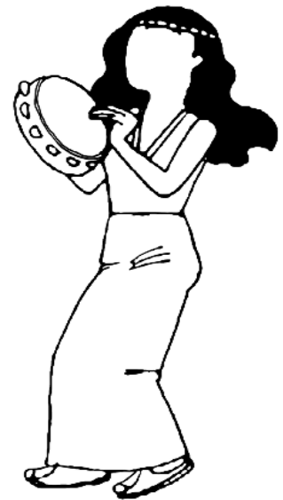
Male Miriam, der Schwester von Mose ein fröhliches Gesicht.