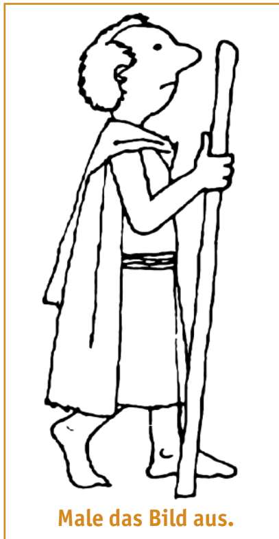
Male das Bild aus.

In Antiochia nannte man die Menschen, die den Herrn Jesus liebten,