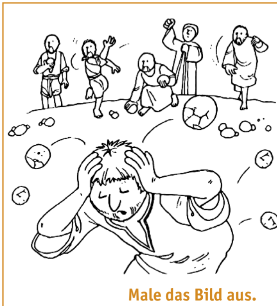
Male das Bild aus.

Oft predigte Stephanus über Jesus. Einige Leute glaubten nicht, was er sagte. Sie erzählten Lügen über Stephanus. Sie wurden so wütend, dass sie ihn aus der Stadt schiffen und ihn mit Steinen bewarfen.