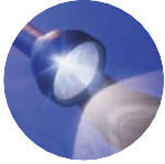
ADNOD ALLWEDDOL I Samuel 20: 17