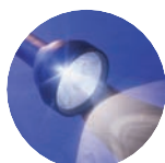
ADNOD ALLWEDDOL Rhufeiniaid 3: 23