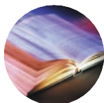
DARLLENWCH Luc 5: 1 - 11