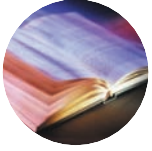
DARLLENWCH Mathew 16: 13 - 23