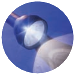
ADNOD ALLWEDDOL Rhufeiniaid 10: 9